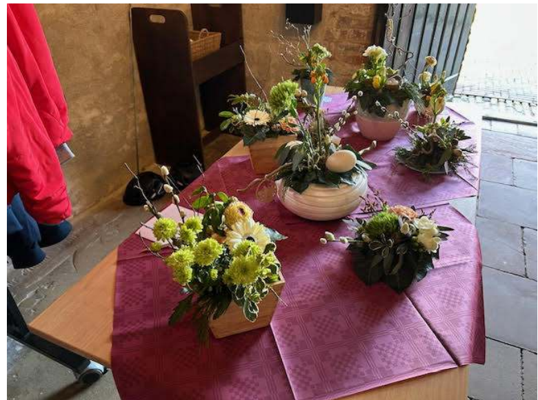
Verkoop van Paasbakjes