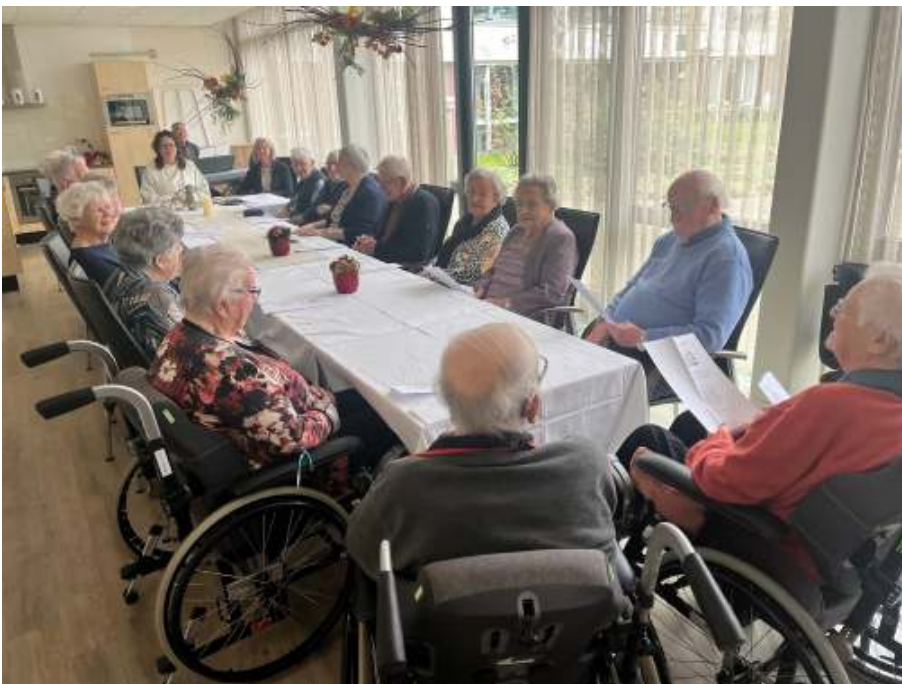
De Avondmaalsviering in de Schuylenburgh op de ochtend van Goede Vrijdag werd goed bezocht. De Opkamer was bijna te klein om iedereen te kunnen voorzien van een zitplaats.

Op Witte Donderdag was er 's avonds een avondmaalsviering in onze kerk. Dit is de eerste van drie vieringen die samen het zogenaamde Paastriduüm vormen en waarin het lijden, sterven en de opstanding van Jezus Christus wordt gevierd. Op deze donderdagavond dus de herdenking van het Laatste Avondmaal. Eenzelfde avondmaalsviering vond op vrijdagochtend plaats met de bewoners van de Schuylenburg (zie foto). Vrijdagavond herdachten wij in onze kerk de kruisiging en dood van Jezus en op Stille Zaterdag was er 's avonds een Paaswake in onze kerk, samen met de drie andere gemeenten van Klavertje 4.